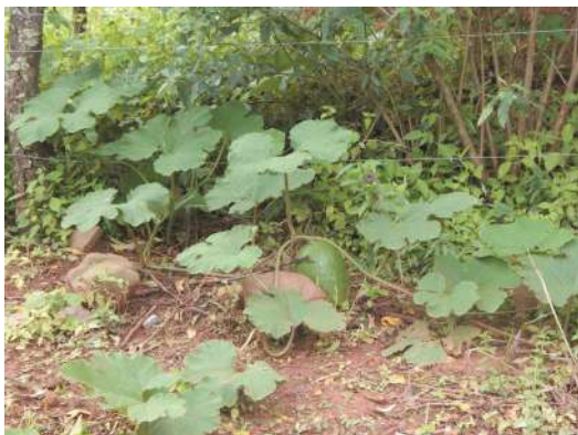
Cucurbita ficifolia a campo.

¿Cómo lo reconocemos? Planta trepadora o rastrera, anual, con zarcillos, resistente a bajas temperaturas pero no a heladas. Tiene tallos ligeramente angulosos. Las hojas son acorazonadas con pecíolos de 5-25 cm, con o sin manchas blancas en el haz, alternas. Posee flores amarillas, solitarias y axilares. Frutos comestibles de hasta 35 cm de largo y hasta 20 cm de ancho, son globosos u ovoide-elípticos de color blanco, verde claro u oscuro, lisos o con estrías o manchas blancas. La pulpa es blanca, dulce, la cáscara rígida y persistente. Semillas de hasta 2 cm de largo de color café