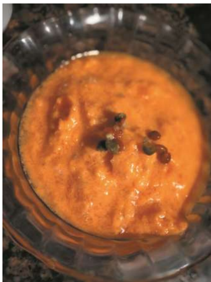
Yasgua con ajíes "quitucho". (L. A. S. Gimenez)

den con la tapa abajo y de esta manera se genere vacío, sobre la mesada esterilizada; luego que se hayan enfriado por completo deben almacenarlos en un lugar oscuro durante 15 días, transcurrido ese tiempo ya puede ser consumido. Generalmente se utilizan estos quituchos así preparados para agregar a los guisos o como integrante de la "yasgua" para asado, picante de