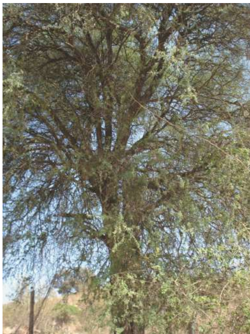
Árbol de chañar en San Pedro de Jujuy.

¿Cómo lo reconocemos? Árboles o arbustos de 3- m de altura, caducifolios con troncos tortuosos y ramas con espinas. La corteza castaño grisácea se abre en hojas longitudinales. Las hojas de 1 a 7 cm de largo, con 5 a 11 divisiones, elípticos a obovados, el terminal de mayor tamaño, de borde entero. Las flores se agrupan en racimos también agrupados, con flores de corola amarilla. El fruto tiene aspecto