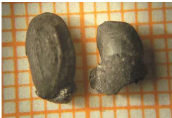
Semilla de algarrobo carbonizada. Sitio arqueológico Rincón Chico 15, Santa María, Catamarca.

En el Noroeste Argentino las sociedades tuvieron distintas dinámicas de ocupación a lo largo de más de 10000 años. En un comienzo eran cazadores recolectores, que iban siguiendo la disponibilidad de recursos a lo largo del año. En distintos sitios arqueológicos de la provincia de Jujuy han dejado registro de su presencia a través