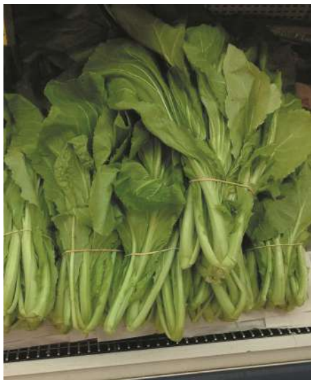
Mostaza china comercializada en el “Barrio Chino” de la Ciudad Autónoma de Buenos Aires.

remojo en agua durante unos 10 minutos. Colocamos agua a hervir en un wok y cocemos las hojas de mostaza durante 3-4 minutos. Enjuagamos las hojas con agua corriente para detener la cocción, escurrimos y reservamos en heladera. Cortamos la carne de cerdo en pequeños cubos de 1 cm. Calentamos un wok a fuego medio hasta que no quede agua. Agregamos una cucharada de aceite vegetal de semillas. Añadimos la carne cerdo y salteamos de 2-3 minutos o hasta que la carne esté casi completamente cocinada. Añadimos entonces el jengibre picado, las setas shitake troceadas, remojadas previamente en agua caliente durante unos minutos y, la cebolleta verde también picada gruesa al aceite, y removemos brevemente. Agregamos los huevos frescos y revolvemos hasta que se cuajen. Incorporamos entonces los trozos de mostaza reservados previamente, y agregamos el arroz largo cocido, revolvemos y freímos todos los ingredientes uniformemente durante 2-3 minutos o hasta que todos ellos estén completamente sofritos. Incorporamos el aceite de sésamo y esparcimos las semillas de sésamo, revolvemos rápidamente y retiramos del fuego.