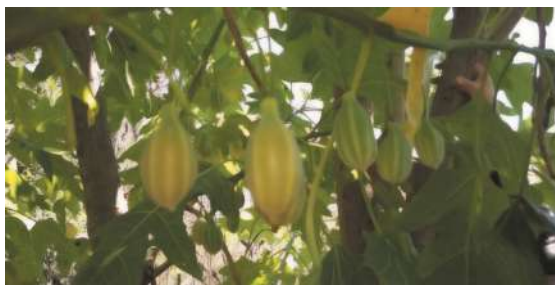
Frutos inmaduros (Río Los Alisos, Palpalá, Jujuy).

¿Cómo la reconocemos? Es un árbol de porte pequeño a mediano de copa poco