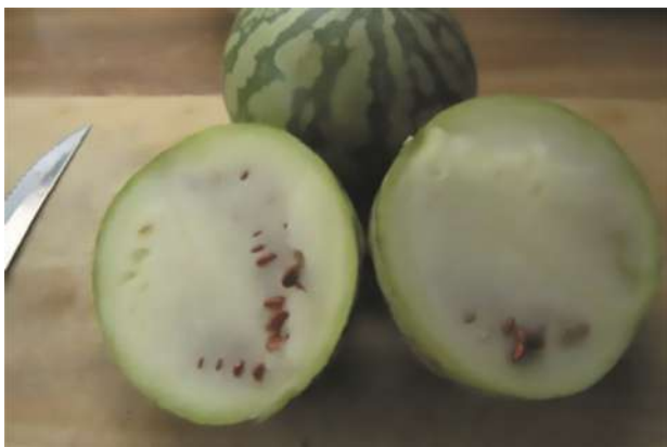
Frutos y semillas de citrón

¿Cómo la reconocemos? La planta es muy similar a la de la sandía. Sus hojas