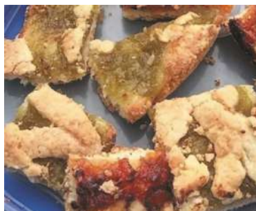
Pasta frola con dulce de tasi

Ingredientes: 1 kg de frutos de tasi, 1 l de agua, 750 gr de azúcar y 1 rama de canela. Elaboración: se cortan los frutos de tasi, se limpian y sacan las semillas. Luego, pelarlos y cortarlos en trozos, ponerlos en una olla con agua y hervirlos hasta que estén tiernos. Agregar el azúcar y la rama de canela. Cocinar hasta que tome consistencia de mermelada.