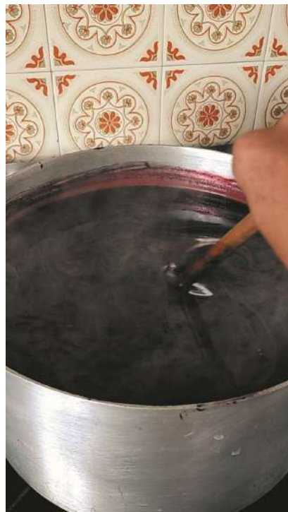
Hervido de la fruta

[1877] 2007). Su leño fue utilizado para la construcción de pipas así como las hojas y la corteza se utilizaron como adulectante del tabaco y se fumaron (Embon 1950). Para el siglo XX entrevistas etnobotánicas a comunidades originarias permitieron establecer la continuidad en el uso de estas plantas como comestible, para manufactura de instrumentos, bebidas, medicina y combustibles (Azar 2002; Martínez Crovetto 1982; Martinic1995). Entre las aplicaciones medicinales Casamiquela (1999) menciona que se reventaban los frutos, se los colaba y se sacaban las semillas, se guardaba el jugo para colar y se ponían unas gotas en los ojos como colirio. En la segunda mitad del siglo XX y principios del siglo XXI este conocimiento perdura en distintas comunidades y pueblos originarios (Ancibor y Pérez de Micou 2002, Mattenet et al. 2015).