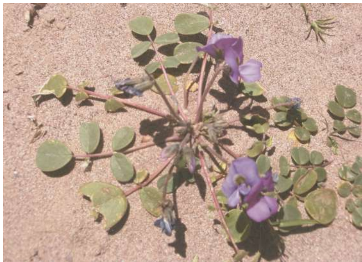
Planta en flor de ajipilla observada en El Moreno, Jujuy.

Las legumbres frescas contienen semillas ricas en proteínas, carbohidratos y fibras, con un contenido de lípidos muy bajo, con ácidos grasos insaturados.