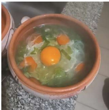
Preparación con Mostaza china

https://miculinaria.wordpress.com/2014/12/13/hojas-de-mostaza-china-verde-salteadas-con-arroz/ . Consultada: octubre de 2023.