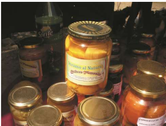
Durazno común amarillo entero y duraznos en almíbar.

Origen de la receta: receta proporcionada por una productora de la comunidad de Juella (Doña T.R.) con quien compartimos muchas horas en su rastrojo, trabajando, charlando sobre los frutales ella tiene.