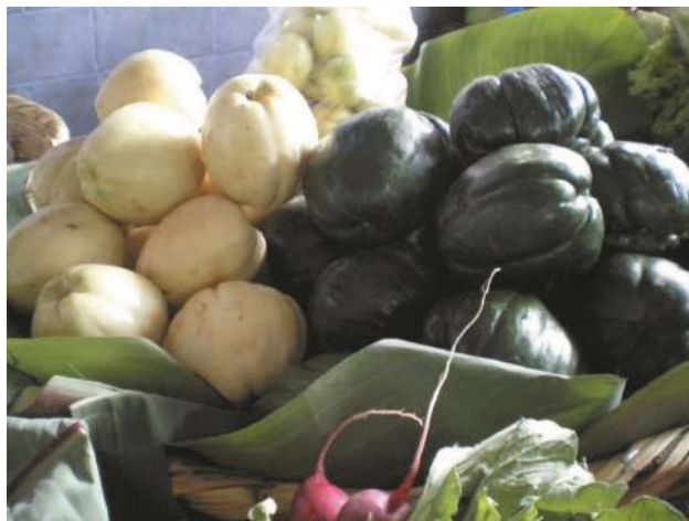
Frutos de Sechium edule en mercado de Chichicastenango (Guatemala 2008).

¿Cómo la reconocemos? Trepadora, perenne y con zarcillos ramificados, de