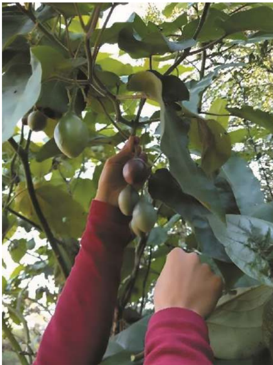
Vista de las hojas y frutos

¿Cómo la reconocemos? Es un árbol pequeño de 2 a 7 m de alto con hojas simples de base cordada a auriculada, ápice acuminado y margen entero. Tiene una inflorescencia con 10-50 flores con corola estrellada, blanco-rosada. El fruto es una baya ovoide o elipsoide, amarilla, anaranjada, roja o morada, generalmente con bandas longitudinales más oscuras.