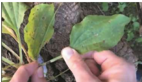
Nervaduras de la hoja de llantén.

queñas, blanquecinas, que se van a convertir en los frutitos, denominados pixidios, que contienen las semillas mucilaginosas.