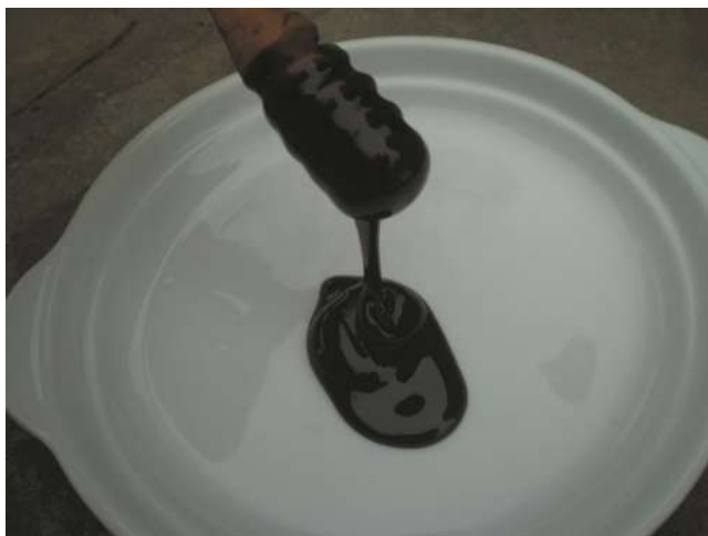
Visualización de Arrope.

Origen de la receta: Esta receta fue recopilada por quien escribe, y ahora recreada y compar-