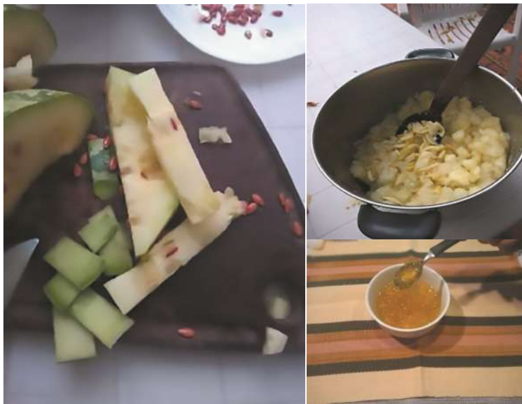
Elaboración de mermelada de citrón

Cortar el citrón en cubitos. Poner en una cacerola el citrón, azúcar y medio limón. Dejar reposar toda la noche. Al día siguiente cocinar hasta que tome consistencia de jalea. (Disponible en: https://www.youtube.com/watch?v=qvglqn2Q0UA )