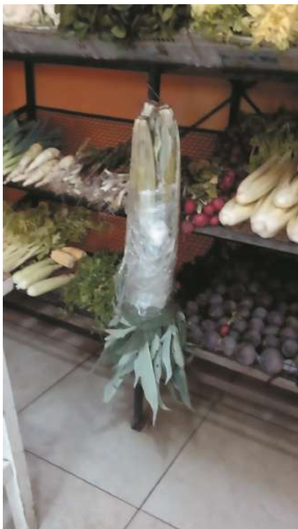
Cardo cultivado en venta en verdulería.

cias de Santa Fe y Córdoba. Con ellos llegaron también las semillas y las prácticas de cultivo de la tierra de origen. Sin embargo, además de establecer la agricultura en su nuevo hogar, se dedicaron a la cría de ganado vacuno para lechería, y hoy en día este territorio ocuparon constituye la mayor cuenca lechera de la Argentina. Por este motivo, el ingrediente original aceite, caro y difícil de conseguir, se reemplazó por un ingrediente graso de fácil disponibilidad: la crema de leche.