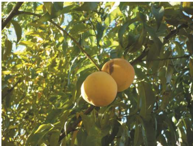
Planta de durazno

¿Cómo la reconocemos? Pequeño árbol de hasta 6 m de altura y corteza lisa. Las hojas son simples, lanceoladas, poco pecioladas, con el margen finamente