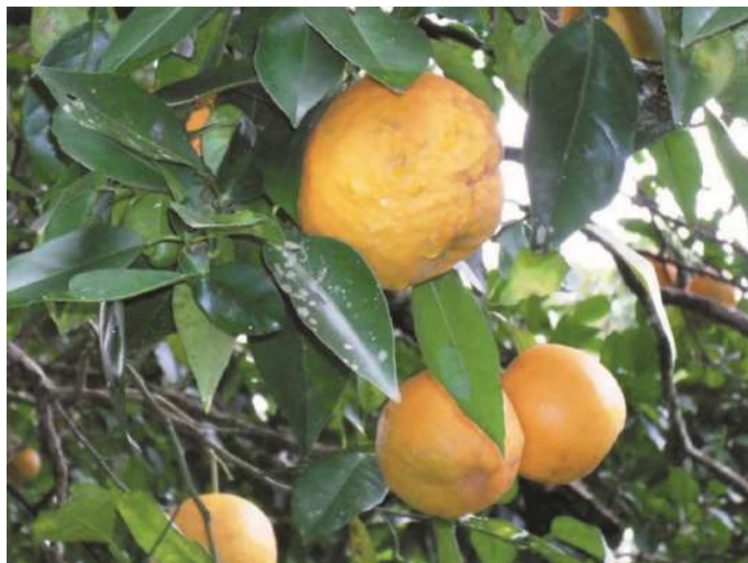
Frutos de plantas de monte de C. x aurantium , Cerro Mártires, Misiones.

¿Cómo la reconocemos? Arbolitos de 3 a 15 m altura, perenifolios, con ramas