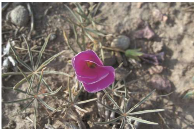
Flor de vino ( Oxalis laciniata )

¿Cómo la reconocemos? Es una hierba de 3-16 cm de alto. Hojas 2-7, estípulas 7x3 mm, folíolos 8-12, lineares, de 5-23 × 1-4 mm, glabros a densamente pubescentes, emarginados, márgenes de crenados y ondulados a completamente lisos y enteros dependiendo del hábitat. Flores hasta de 60 mm de diámetro; sépalos elípticos, de 10 × 4 mm, obtusos o agudos; pétalos 3-5 veces el largo de los sépalos, unguiculados, rosados a violáceos, a veces con líneas y la garganta violácea. Cápsulas globosas,