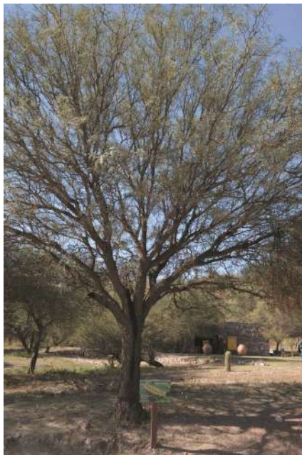
Árbol de Neltuma flexuosa

Neltuma alba tiene una altura máxima entre 15 y 18 m, y generalmente la copa es hemiesférica. Hojas divididas caducas, color verde claro brillante durante la brotación en primavera y más oscuras durante el otoño. Las flores, pequeñas y perfumadas, están reunidas en racimos cilíndricos amarillo-verdosos, péndulos de 4 a 12 cm de longitud. Puede tener una segunda floración uno o dos meses después de la primera. El fruto es una legumbre recta, chata, márgenes paralelos manifestos, 12- 25 cm longitud, 11-20 mm lat. x 4-5 mm grosor; pericarpio pajizo-amarillento, mesocarpio carnoso, azucarado; artejos 12-30, rectangulares de aproximadamente 1 x 0,6 cm, conteniendo la semilla, elíptica a ovada, 4,2-