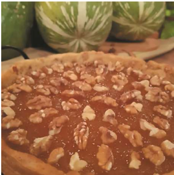
Tarta de cayote y nuez.

Elaboración: Con las manos hacer un arenado con la harina, la manteca y el azúcar. Agregarle las 3 yemas y la miel de caña. Luego incorporar las nueces picadas. Formar y estirar la masa. Dejarla reposar por 20 minutos en la heladera. Estirar la masa en una tartera. Poner por encima un papel metálico con garbanzos, porotos o algo que haga peso para evitar que la masa se levante. Llevar al horno a 175°C por 15/20 minutos. Luego dejar enfriar e incorporar el dulce de cayote y decorar con las nueces.