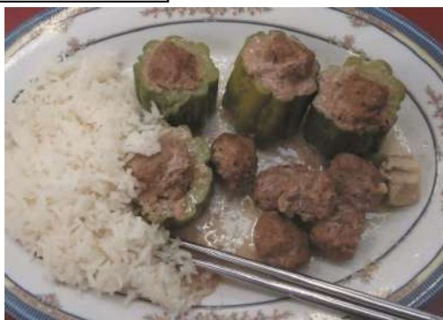
Pepino amargo relleno