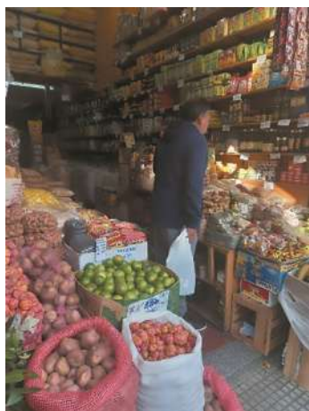
Mercado boliviano de Liniers, Buenos Aires.