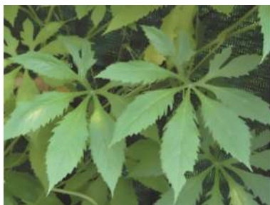
Forma de la hoja de Achojcha

¿Cómo la reconocemos? Se sostiene mediante zarcillos trifidos y cubre fácil y rápidamente las superficies que la soportan. Sus hojas son partidas, palmadas, con bordes aserrados. Las flores son unisexuales, pero se encuentran tanto las masculinas como las femeninas en la misma planta (monoicas). Son amarillentas, pequeñas, y muy perfumadas. El fruto es una baya ovoidea, verdosa, con venas de color más oscuro, de 10-