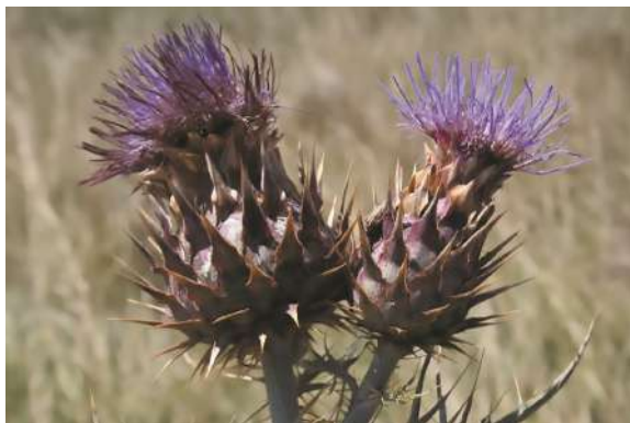
Rama florífera de Cynara cardunculus silvestre.

¿Cómo la reconocemos? Es una planta con una roseta de grandes hojas de hasta un metro de longitud y 0,6 m de ancho, profundamente divididas, espinosas,