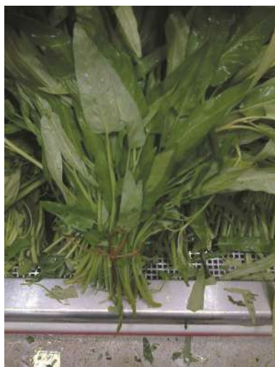
Espinaca china comercializada en el “Barrio Chino” de la Ciudad Autónoma de Buenos Aires.

¿Cuál es su historia y tradición? La espinaca china se cultiva en el sur de China como comestible, y se halla muy difundida en el Sudeste asiático, en especial, en la cocina tailandesa, como plato principal o guarnición. En los Estados Unidos se considera maleza y por lo tanto se prohíbe su cultivo en muchos estados; no obstante, en Texas se permite solo para consumo personal, debido a su innegable potencial culinario ( https://www.thaicookingkohtao.com/recipe/morning-glory . Consultada: octubre 2023). En el sector periurbano del Área Metropolitana de Buenos Aires, Argentina, se ha cultivado en huertas de inmigrantes chinos. Las hojas se comen crudas, hervidas, sofritas o salteadas, para ensaladas y guarniciones de platos con vegetales, fideos, carnes, pescados y mariscos (Fang & Staples 1995; Hurrell et al. 2019; Puentes et al. 2019).