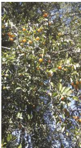
Vista de hojas, ramas y frutos del Tala.

aspecto irregular, con troncos de hasta 80 cm de diámetro y corteza rugosa. Sus ramas en zig-zag, con espinas rectas y axilares llevan hojas con forma de huevo, algo asimétricas y con borde aserrado. Estas se disponen de manera alternada y son de color uniforme en ambos lados, mientras que las nervadu-