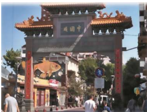
Barrio chino. Buenos Aires