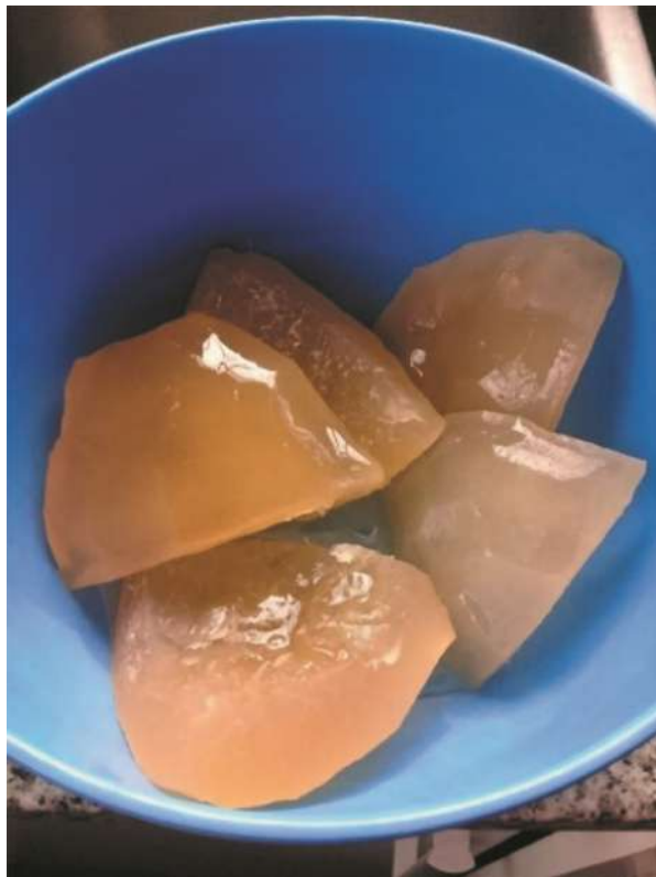
Dulce de “naranja amarga” (en orejas) en almíbar.

las semillas. Se colocan los cuartos de las frutas en agua hervida con sal por algunas horas. Las cáscaras, junto al clavo de olor, son alternadas con azúcar y luego se cubren completamente con agua. Se le da un hervor de 20 minutos y se deja reposar toda la noche. Al otro día se hierva nuevamente por 20 minutos y se deja reposar. Se agrega agua en caso que sea necesario para que las cáscaras se mantengan cubiertas de almíbar. Se repite este proceso hasta que las cáscaras estén tiernas y se oscurezcan. Se deja enfriar y se guarda en frascos grandes con su almíbar. Se acostumbra a consumir como postre junto a queso.