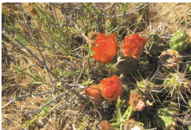
Vista general de la Tuna.

¿Cómo la reconocemos? Cactus perenne de hasta 1 m de altura y 1 m de diámetro,