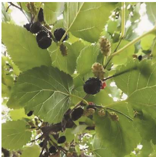
Rama con frutos

¿Cómo la reconocemos? Es un árbol de tamaño medio, aunque puede presentarse