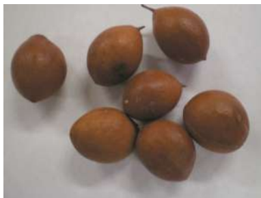
Frutos de chañar maduros

drupáceo, ovoide a globoso, de 1,5 a 3 cm de diámetro, rojizo, lustroso y contiene una semilla fusiforme, hasta de 1,8 cm de largo, blanda y rojizas. (Burkart 1952).