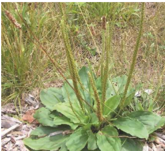
Vista general del llantén.

¿Cómo la reconocemos? El llantén es una hierba perenne con hojas aovadas