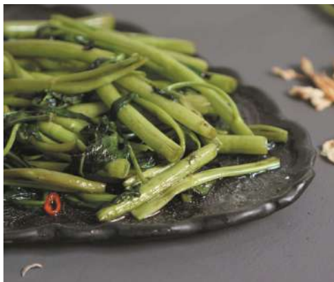
Preparación con espinaca china