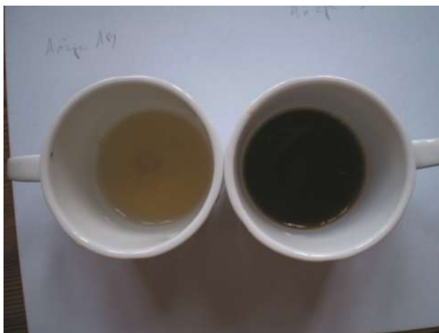
Visualización de Añapa y Aloja

Elaboración: Para su elaboración se ponen las vainas en una bolsa y se golpean con el “pisón” o palo largo de madera (otra opción es partirlas a mano en fragmentos de 2 a 3 artejos). Se remojan las vainas molidas para lavarlas y luego se las pasa a una olla y se cubren con el doble de agua. Se hierva. Cuando están blandas se amasan sobre una bolsa de arpillera o un cedidor fino de metal. El líquido viscoso obtenido a través del colado se hace hervir en una paila, sin azúcar. La “paila” es una gran batea de cobre con manijas. La paila se coloca por arriba del fogón y se puede fijar con adobe alrededor. Se envasa en frascos y se almacena hasta un año (Capparelli 2007).