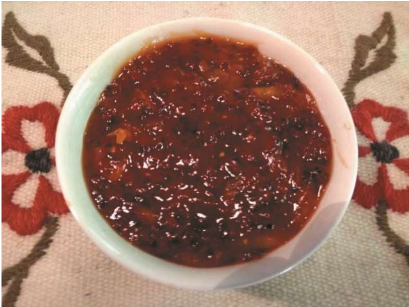
Chutney de tomate de campo

Ingredientes: 1 kg de tomates de campo, pelados con agua hirviendo; 500 g de azúcar; 250 cc de vinagre de manzana, 1 cebolla y 1 diente de ajo picados. Sal y condimentos (pimienta, canela, clavo de olor, cardamomo, nuez moscada, aji molido u otro picante) a gusto. Elaboración: Cortar los frutos en trozos pequeños, agregar todos los demás ingredientes y cocinar hasta obtener una mermelada ligera. Ideal para acompañar carnes o quesos.