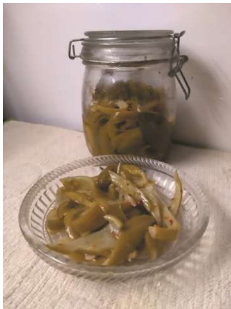
Encurtido de achojcha

Elaboración: Lavar bien los frutos de achojcha, cortarlos en tiras longitudinales. Hacer hervir el agua con vinagre, sal, laurel y pimienta. Agregar las tiras de achojcha y cocinar cinco minutos. Escurrir. Poner en frascos esterilizados las tiras de achojcha (procurando incluir los condimentos que acompañaron el hervor), agregar ajo, ají molido (u otros condimentos a elección: orégano, perejil...) y cubrir con aceite.