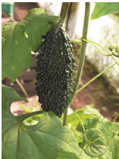
Vista general de cultivo de pepino amargo

¿Cómo la reconocemos? Hierbas anuales, trepadoras, monoicas usualmente muy