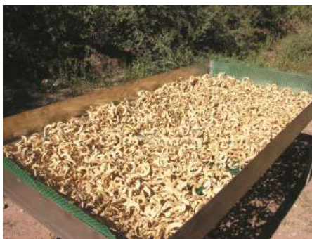
Vainas de Neltuma alba secándose al sol.

bien sequitas, como “bizcocho”). La harina de las vainas molidas se puede almacenar por un tiempo en un lugar fresco y seco. Para hacer la añapa se coloca la molienda en una ollita, a la que se le agrega el agua fría. Se tapa y se deja reposar desde una hora hasta 2 días, depende de la urgencia en consumirla. Se puede envolver la ollita con un paño mojado con agua fría para que se conserve fresca. Luego, o bien se saca el líquido sobrenadante con un jarrito, o bien se van aprisionando las vainas molidas con ambas manos, es decir que “se las chusma” o que “se hace un ovillito”, y se va juntando el agua de expresión en otra ollita o jarra. En lugar de aprisionar los puñados, se puede colar la mezcla con un colador. La fracción líquida resultante se coloca en la heladera para tomar como refresco en cualquier momento. La añapa se puede hacer también con el residuo de la molienda de las vainas luego de extraer la harina fina con la que se hace el “patay” (una especie de pan o bizcocho) (Capparelli 2007).