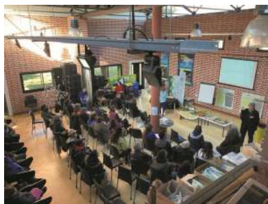
Actividad realizada en el marco del proyecto

Nuestro proyecto se enmarca dentro del objetivo que propone poner fin al hambre, lograr la seguridad alimentaria, mejorar la nutrición y promover la agricultura sostenible de la iniciativa Objetivos del Desarrollo Sostenible (2015-2030) de la ONU. Esperamos armar una colección viva de semillas y de memoria agrícola y culinaria y promover su intercambio y comunicación. Como venimos haciendo desde otros proyectos previos, tanto de investigación como de extensión, pretendemos reconstruir la histo-