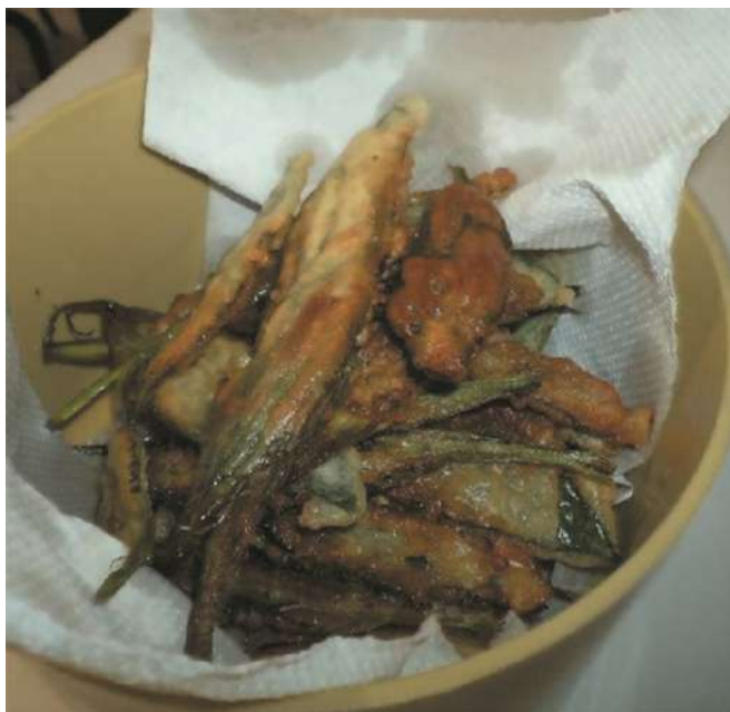
Formitas de Llantén

Elaboración: En un bol batir el huevo con la leche, luego agregar la harina de a poco e ir batiendo hasta que no haya grumos (que no quede muy líquida la masa). Lavar bien las hojas de llantén (dejar unos minutos en remojo con 3 gotitas de lavandina por litro de agua). En una sartén poner el aceite y llevar a la hornalla hasta que esté bien caliente. Pasar las hojas por el preparado y freír hasta dorar. Una vez cocidas agregar sal a gusto y ¡a comer!