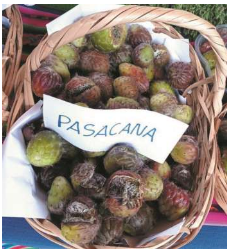
Frutos de Cardón