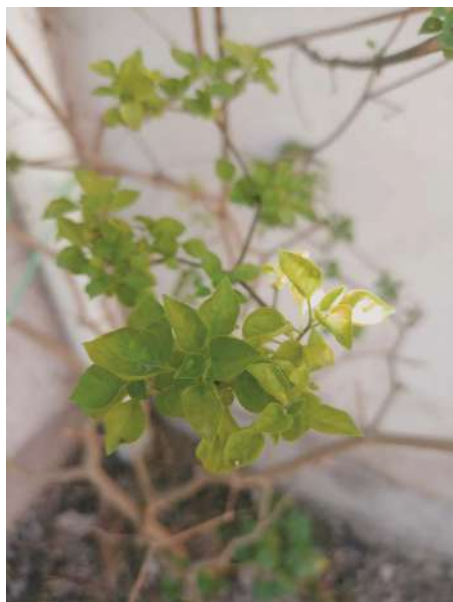
Vista general de la planta

¿Cómo la reconocemos? Es un arbusto de 1,5 - 3,5 m de altura., con flores solitarias o en grupos de 2 ó 3, corola blanca con manchas de color verdoso-amarillento de 4,5 - 7,5 mm de longitud, anteras amarillas de 1,5 - 1,8 mm de longitud, muy notorias. Sus frutos son oblongos, obtusos, rojos, picantes, con semillas lisas, color canela (Hunziker 1998).