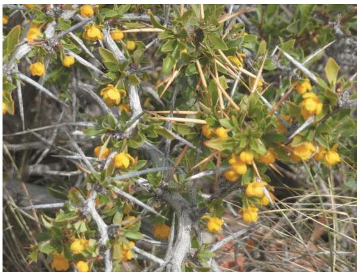
Calafate en flor.

¿Cómo la reconocemos? Es un arbusto muy espinoso llegando hasta 1,50 m de