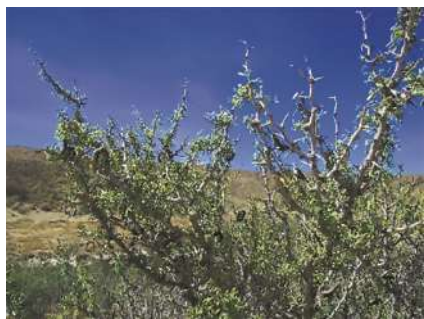
Neltuma denudans –algarrobito– en la Reserva de Ría Deseado, Santa Cruz.

¿Cómo la reconocemos? Es un arbusto de 1– 2 m de alto, espinoso, de ramas arqueadas, anudado, con espinas siempre axilares, solitarias, duras de 0,5 –4 cm largo. Las hojas son alternadas, divididas, las divisiones de 6 – 18 mm de largo. El grupo de flores es amarillento-verdoso se disponen en racimos axilares, con el pie corto. El fruto de este género consiste en una legumbre drupácea que no se abre al madurar (Burkart 1952:126).