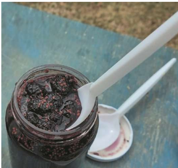
Mermelada de moras.

¿Cuál es la historia y tradición? En su área de origen, la China, sus hojas cobran particular importancia como alimento para el gusano de seda y el árbol se emplea como fuente para la obtención de madera. Las hojas pueden consumirse como verdura (como ejemplo mencionamos una receta coreana: sopa de porotos de soja con hojas de morera fritas, también para envolver alimentos, y para té a modo de té verde). En medicina tradicional se le atribuyen a los frutos propiedades como laxante suave, protector capilar; las hojas serían hipoglucemiantes, anti-