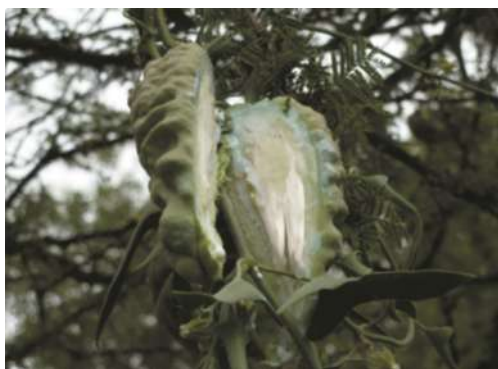
Fruto de Tasi

¿Cómo lo reconocemos? Planta con hojas simples, opuesta, pecíolos de 1 a 2