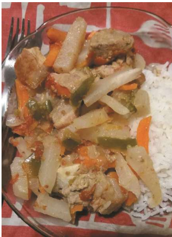
Estofado de papas del aire con carne. (L. A. S. Gimenez)

Elaboración: En una olla grande, calienta el aceite a fuego medio y agrega la cebolla junto con el morrón verde y rojo y el ajo, cocinándose hasta que se doren y desprendan sus aromas. Si buscas un toque picante en tu estofado, puedes incorporar