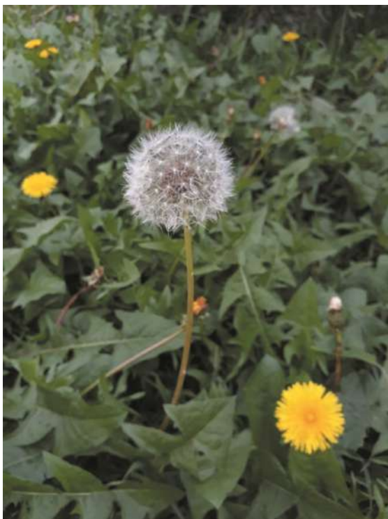
Vista general del Diente de León.

¿Cómo lo reconocemos? El diente de león es una hierba con hojas dentadas que