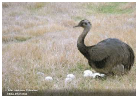
Ñandú ( Rhea americana )

Entre las formas de aprovechamiento podemos destacar el trozamiento, fileteado, extracción de médula ósea, mientras que las modalidades de cocción incluyen la exposición al fuego y al calor, mediante el asado, el rescoldo, los guisados y hervidos (Auge y Day Pilaría 2023; Day Pilaría 2018). Esta perspectiva de análisis nos ofrece evidencias para conocer los complejos entramados de saberes, creencias y prácticas involucradas en las cocinas y las comidas del pasado (Auge y Day Pilaría 2023).