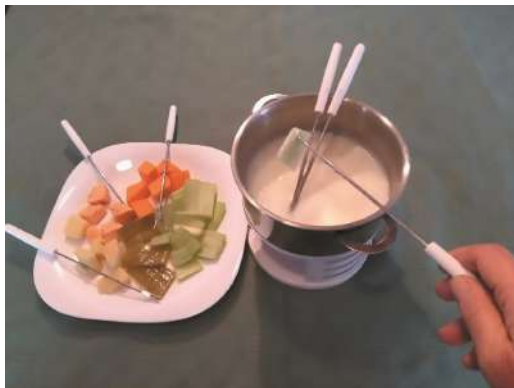
Bagna cauda: hacia la derecha, pecíolos de cardo crudos y hacia el centro hervidos.

productos lácteos y su cada vez menor tenor graso, es probable que quede muy líquida. En ese caso espesar con una pequeña cantidad de almidón de maíz diluido en leche. Llevar a la mesa bien caliente, preferentemente en recipiente con calentador para mantener la temperatura. Se dispondrán los cardos y otras verduras en platos en la mesa para que los comensales los tomen a gusto. Con el pinche se toma un trozo de cardo y se sumerge en la bagna cauda. Se aconseja utilizar una rebanada de pan como soporte para el trayecto de la fuente a la boca. Los puristas aconsejan