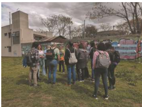
Caminata de reconocimiento de las especies NUS.

A través de estas recetas esperamos visibilizar gran número de especies olvidadas e infrautilizadas (NUS) tanto cultivadas a menor escala en otras zonas como silvestres y potencialmente cultivables, potenciando su producción y consumo, y aportando al incremento de la agrodiversidad en las zonas donde trabajamos.