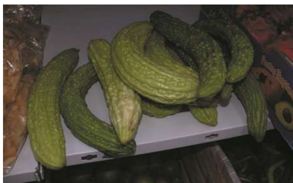
Pepino amargo cultivado en el Área Metropolitana de Buenos Aires.

¿Cuál es su historia y tradición? Las semillas crudas son tóxicas, sobre todo, si se exagera su consumo. No obstante, pueden hervirse en agua o leche, y comerse enharinadas y fritas (Rapoport et al. 2009). En el sector periurbano del Área Metropolitana de Buenos Aires, Argentina, se ha cultivado en huertas de inmigrantes chinos. Los frutos se comen hervidos, fritos, sofritos o encurtidos, para ensaladas, sopas y platos diversos con vegetales y carnes (Hurrell et al. 2019; Lu & Jeffrey 2011; Puentes et al. 2019; Rapoport et al. 2009).