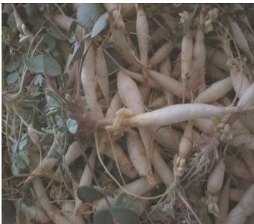
Raíz tuberosa observada en El Moreno, Jujuy.

Ensalada primaveral con toque andino Ingredientes: quinoa cocida, ajipilla, to-