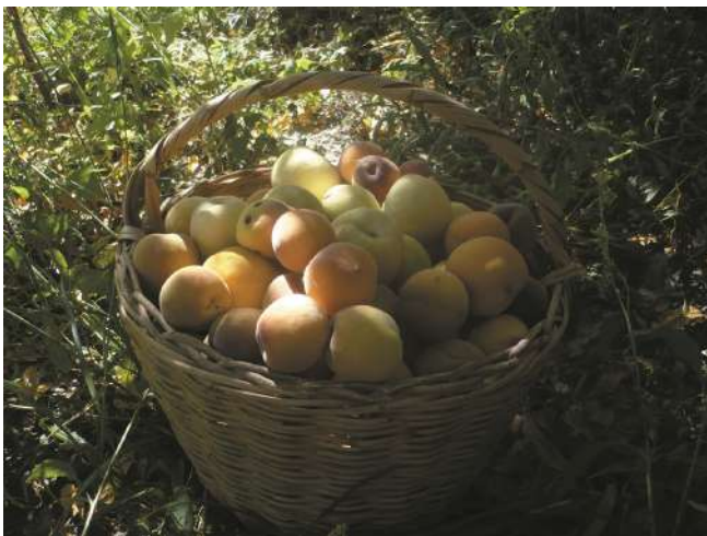
Diversidad de etnovarietad de duraznos en Juella (Quebrada de Humahuaca, Jujuy, Argentina).

bitan desde la antigüedad la zona, quienes lo conservan principalmente para alimentación, comercio local y trueque. Por medio de la conservación - sea como