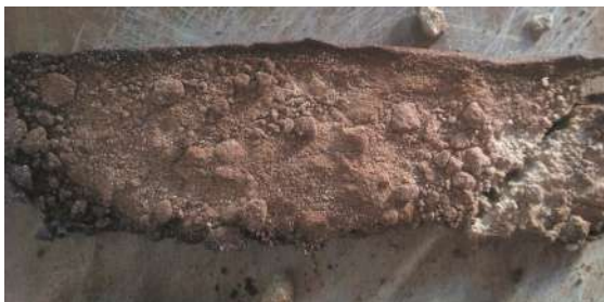
Patay de algarroba, elaboración artesanal.

Elaboración: Se colocan las vainas enteras sobre ceniza caliente hasta que se observe que estén tostadas. Luego, se machacan en mortero de piedra para obtener una harina. Capparelli (2008) registra que luego de 140 segundos se obtiene una harina refinada con una mano de piedra de 770 g y 5,9 y 6,8 g de vainas. Se filtra el producto a través del cedazo de tela y se desechan el endocarpo y semilla o se guarda para la realización de otras preparaciones. La fracción fina se coloca en moldes a los que se les hecha un chorrito de aceite y se tuesta al horno de barro, a las brasas o al sol. Con el calor, las resinas y el azúcar la preparación se compacta y queda como un pan. También, se puede disolver en agua y mezclarse con harina de maíz, un producto similar al ulpo del noroeste argentino.