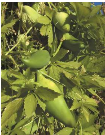
Fruto de Achojcha

20 cm de largo, hueca, con varias semillas negras irregulares. Hay variedades con frutos