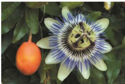
Flor y fruto de mburucuyá.

¿Cómo la reconocemos? Es una planta trepadora, que se sostiene mediante zarcillos que se enroscan al soporte y puede ascender hasta 25 m de altura. Sus hojas son partidas, palmadas, de color verde brillante. Las flores son muy llamativas, y a ellas debe la especie el nombre local de pasionaria ya que se dice que reproduce la pasión de Jesucristo. La flor tiene cinco sépalos y cinco pétalos blanquecinos (los apóstoles aunque no son 12), sobre los que se superpone una corona de filamentos azulados (corona de espinas) sobre la cual destacan los estambres amarillentos (las llagas de Cristo) y el estigma trifido, azulado (los clavos de la cruz). El fruto es una baya ovoidea, naranja de unos 5 cm de largo, y contiene numerosas semillas rodeadas por una pulpa mucilaginoso (arilo) color granate.