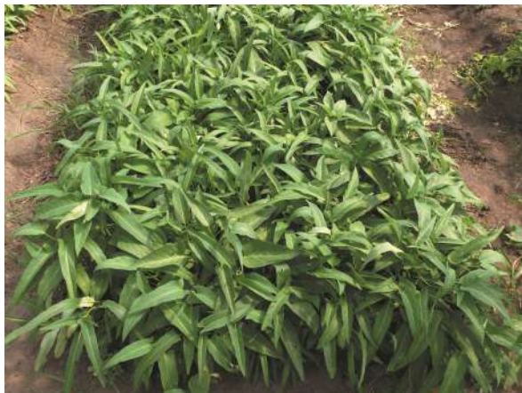
Vista general de cultivo de espinaca china

¿Cómo la reconocemos? Hierbas anuales, terrestres y rastreras, o acuáticas flo-