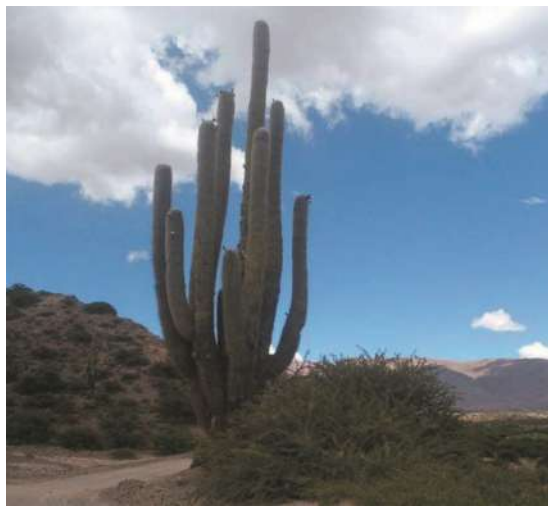
Planta de Cardón

¿Cómo la reconocemos? es una planta arborescente. El tallo central sobrepasando las ramas, hasta 50 cm diámetro., con unas 40 costillas. Las ramas cercanas y paralelas al tronco, Espinas muchas, rectas, castaño-amarillentas de distinta longitud y rigidez. Flores laterales en la parte superior del tronco y de las ramas blancas o cremosas. Frutos verdes, globosos, dehiscentes, denominado pasacana cubiertos por pelos blancuzcos, con pulpa blanca agrídulce; estilo persistente. Semillas negras, opacas.