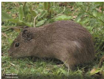
Cuis pampeano ( Cavia aperea )

La alimentación de la humanidad no se limita ni histórica ni actualmente a los vegetales. Nos preguntamos si sería posible considerar como NUS a aquellas especies animales olvidadas o infrautilizadas y en ese caso redefinir el término.