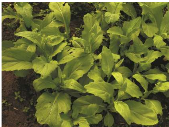
Vista general de cultivo de mostaza china.

¿Cómo la reconocemos? Es una hierba anual, pubescente a glabra, de 0,3-1,8 m altura. Posee tallos erectos. Las hojas inferiores poseen pecíolos de 2-15 cm longitud, láminas verdes o castañas, de 4-8 cm longitud × 2-28 cm lateral., partidas, con bordes mayormente dentados, el segmento terminal ovado, con 1-3 segmentos laterales de menor tamaño; las hojas superiores tienen pecíolos cortos, son oblongas, elípticas a lineares. Presenta flores amarillas en inflorescencias en racimos hasta de 30 cm longitud. El fruto es una silícula linear, 3-6 mm longitud glabra.