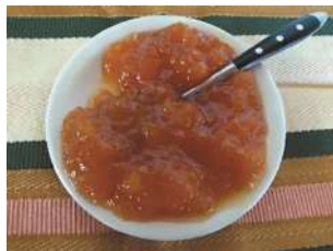
Mermelada de higo de zorro

Elaboración: Cosechar los higos maduros, pelarlos y hacerlos hervir con el agua, el azúcar y la canela, aproximadamente 45 minutos a una hora. Pasado ese tiempo se tiene que triturar. Dejar enfriar, envasar y llevar a la heladera. Receta de doña C. F.