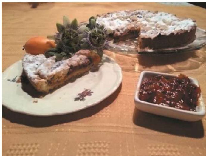
Pasta frola de mburucuyá.

Origen de la receta: esta receta fue generada por integrantes del Laboratorio de Etnobotánica y Botánica Aplicada como parte de los proyectos de extensión destinados a potenciar el uso de la flora nativa.