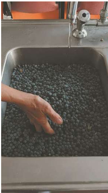
Lavado de los frutos de Calafate.

Ingredientes: 1kg de calafate y 1kg de azúcar