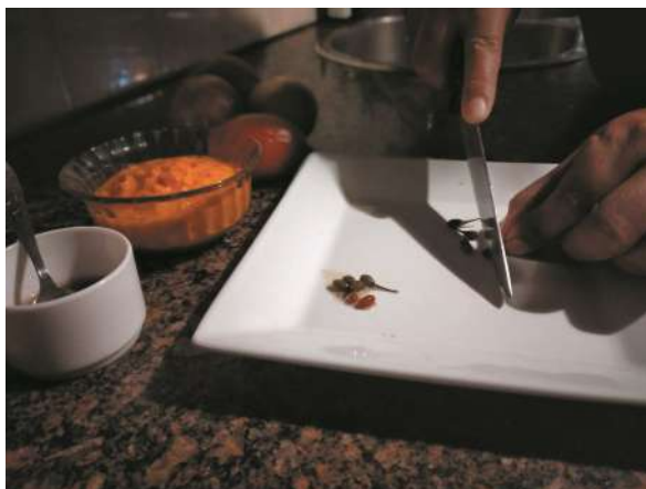
Quituchos en vinagre para preparación de alimentos. (L. A. S. Gimenez)

con este proceso hasta que llegue al cuello del frasco y luego se agrega, lentamente, vinagre blanco hasta la misma altura del preparado, limpiar el frasco y cerrarlo. En una cacerola colocar un repasador en el fondo (mantiene quietos durante el hervor los frascos, evitando golpes y roturas), agregar los frascos con el producto, incorporar agua, por último, hasta el cuello de éstos y llevarlos a fuego dejando que hiervan durante 40 min. Una vez cumplido el tiempo dejarlos reposar 10 min más y retirarlos del agua, colocándolos de forma que que-