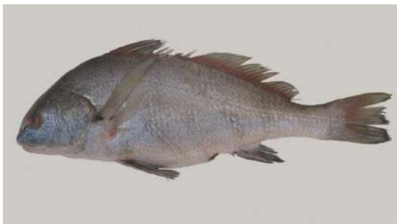
Corvina negra ( Pogonias courbina ) Tomado de Aspelicueta et al. 2019

Sin embargo, algunos de los animales utilizados desde tiempos remotos y presentes en registro arqueológico como el ciervo de los pantanos, se ven amenazadas por distintos motivos, ya sea la sobreexplotación o la modificación de las condiciones ambientales. Por ello son especies en peligro o incluso en extinción. Esto ha generado distintas reglamentaciones que aplican vedas que impiden o recomiendan no