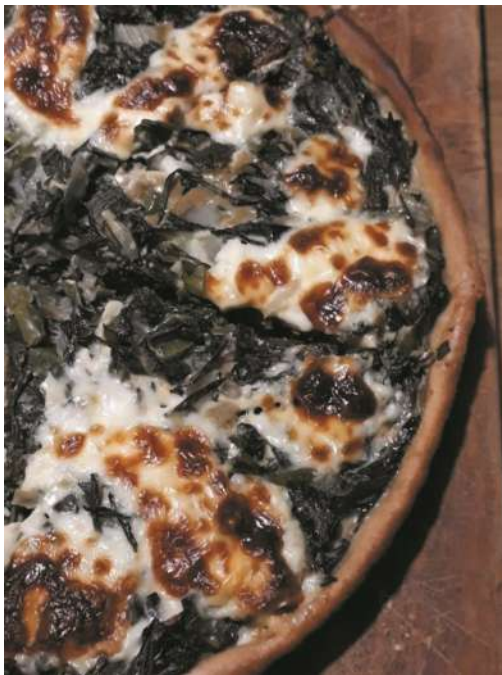
Tarta de Diente de León.

Mezclar queso blanco con la cantidad que uno quiera de hojas y/o flores de diente de león (o flores de taco de reina, o mastuerzo -como es picanito queda exquisito-) y poner para untar galletitas o tostadas como entrada o en una picada.