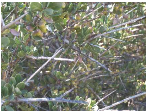
Vista de las hojas y ramificación

¿Cómo lo reconocemos? Es un arbusto perenne, tendido o recostado de 0,8-1,5