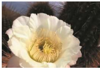
Flor de Cardón

El fruto de pulpa jugosa que tiene propiedades medicinales para tratamiento de úlceras, alergias, fatiga, reumatis-